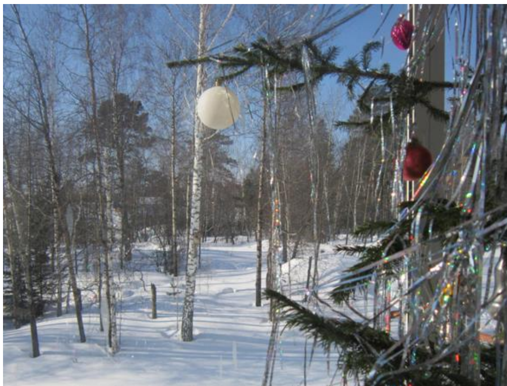
На фото: вид из нашего окна

«Человечество стало б счастливым давно В единенье с природой». – Как чист И возвышенно радостен день за окном! А, наверное, прав декабрист.