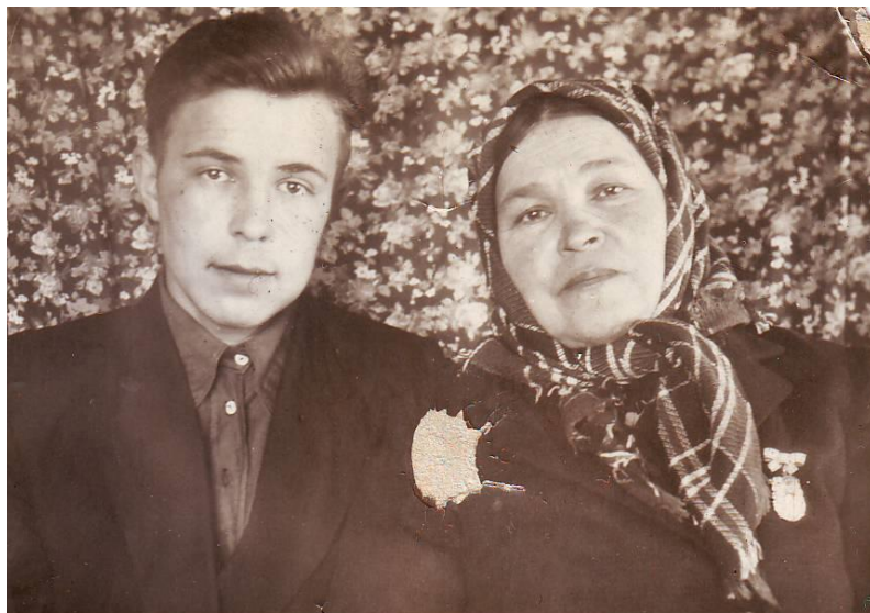
На фото: мать с сыном.

Погиб он под Сталинградом, где вся земля полита кровью, а у нас слезами. Вернётся с работы отец, спросит: «Где мать?» И идут искать её в лесу, куда она убежала изливаться своей горе по ненаглядным погибшим сыночкам». Лес исцелял её израненную душу.