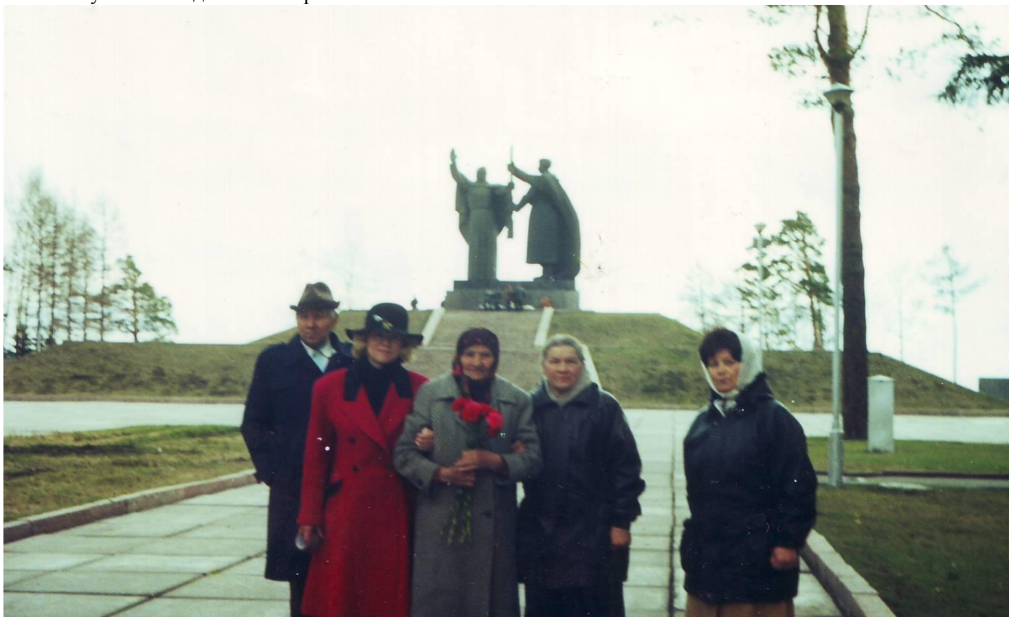
На фото: У вечного огня