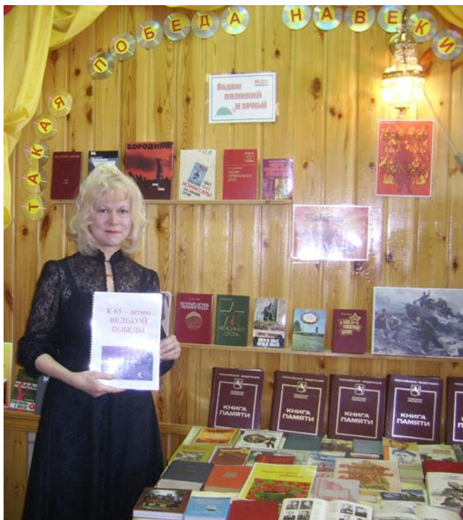
На фото: презентация альманаха

Была проведена презентация альманаха, которая никого не оставила равнодушным. Долго ходил альманах от читателя к читателю. Люди не могли читать его без слёз.