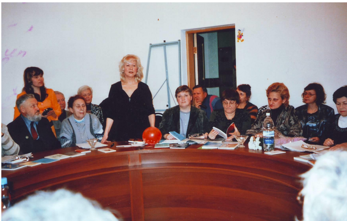
На фото: вечер в литературном клубе «Автограф»

На литературном конкурсе, посвящённом 90-летию со дня рождения Галины Николаевой (2001г.), присуждено призовое место в номинации «Поэзия». В 2004 году стала лауреатом областного литературного конкурса: «Звучащее слово», посвящённого 400-летию Томска. Издан лауреатский сборник: «Строки, рождённые сердцем».